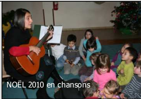
NOËL 2010 en chansons

- Le 11/12/2010 : fête de Noël. 80 enfants se sont émerveillés devant l'éclat et la blancheur du Père Noël toujours aussi généreux avec sa hotte en osier pleine à ras bord. Spectacle et cadeaux pour les petits, cinéma pour les plus grands. Le goûter a clôturé l'après-midi.